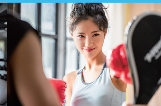
有酸素キックボクシング