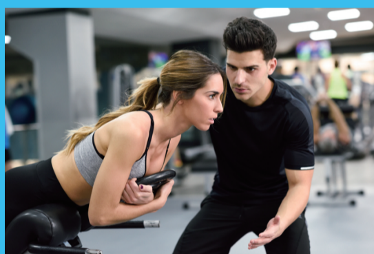
筋力トレーニング